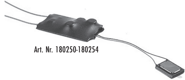
Art. Nr. 180250-180254