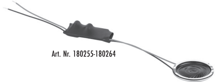
Art. Nr. 180255-180264