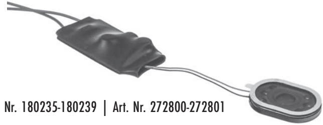
Art. Nr. 180235-180239 | Art. Nr. 272800-272801